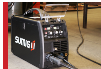
Flexível para diversos tipos de trabalho