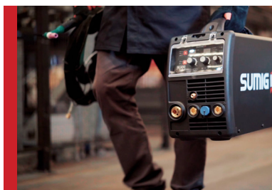
Fácil Movimentação. Portátil e Compacto