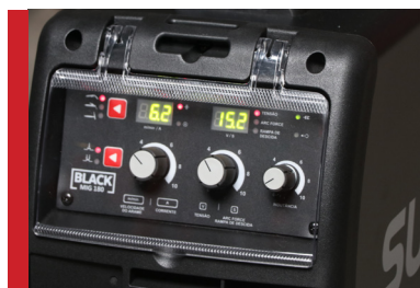
Ajuste fino dos parâmetros de solda