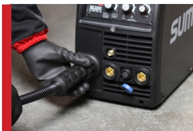
Cabos e Engates Precisos