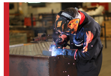
Baixo Consumo de Energia