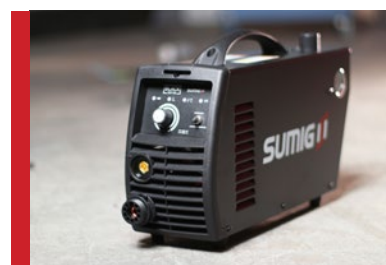
Flexível para diversos tipos de trabalho