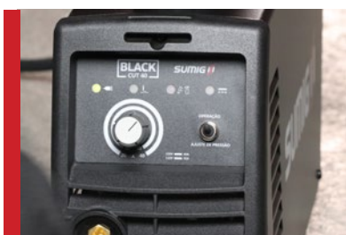
Painel de Fácil Ajuste