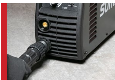
Cabos e Engates Precisos