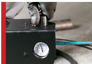
Ajuste de Pressão