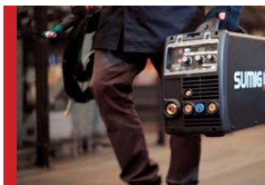
Fácil Movimentação. Portátil e Compacto