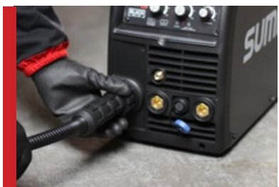
Cabos e Engates Precisos