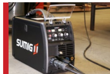
Flexível para diversos tipos de trabalho