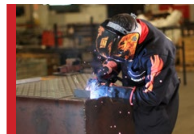
Baixo Consumo de Energia