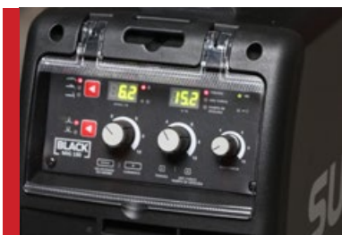
Ajuste fino dos parâmetros de solda