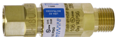
Válvulas secas tipo corta chama para reguladores