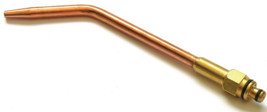
Extensão de solda oxyline 201 acetileno chama simples