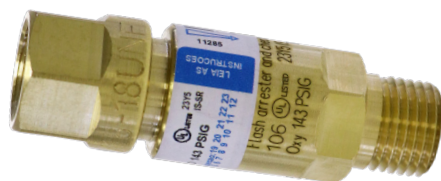
Válvulas secas tipo corta chama para maçaricos