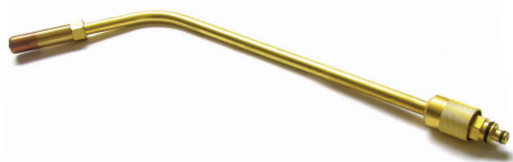
Extensão de aquecimento tipo multichama (chuveirinho)