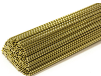
Vareta de Alpaca (solda oxiacetilênica)