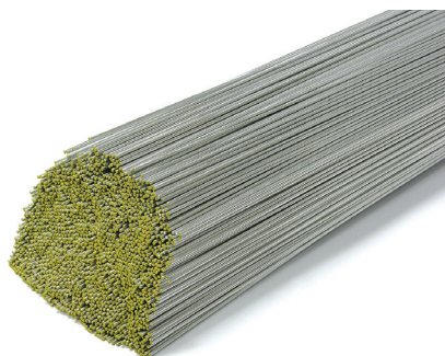
AWS ER 4043 (solda tig oxiacetilênica)

Indicadas Principalmente na Manutenção em Geral, Devido a Elevadíssima Resistência Mecânica