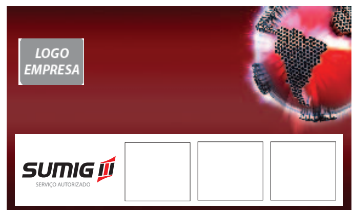
Cartão de visita - Exemplo autorizadas Sumig e outras marcas