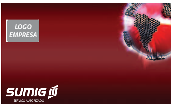
Cartão de visita - Exemplo autorizadas exclusivas

Para aplicações menores que 6 cm, veja a imagem abaixo. Para fundos coloridos consulte os tipos de aplicação.