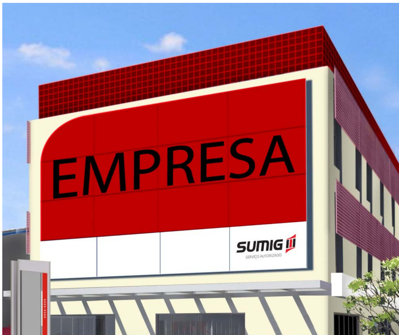
Modelo de Placa

Abaixo ilustramos alguns modelos de aplicações externas. Os modelos de aplicações externas devem respeitar as margens de segurança (unidade "X", pág. 02). Autorizadas exclusivas Sumig Modelo Fachada.